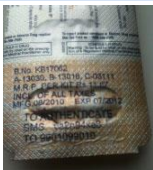
Примерок на број на производ поврзан со податоци од база

Во последните 20 години со значителниот развој на мобилните уреди се овозможи развој на голем број апликации кои се користат за автентификација на бар кодовите. Една од ваквите употреби е користењето на SMS решенија за верификација на информациите кои се наоѓаат на фармацевтските производи со податоците кои се содржани во база на податоци.