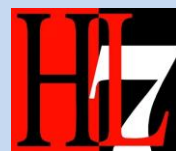
Health Level Seven (HL7)

GS1 и HL7 направија уште еден голем чекор за подобрување на глобалното здравство на Конференција за Здравство во Сан Франциско, САД, од 1-3 Октомври 2013, обновувајќи го Меморандумот за разбирање со кој се обврзуваат на соработка со цел редуцирање на медицинските грешки и пораст на ефикасноста на синџирот на снабдување во Здравството. Меморандумот за разбирање го потпишаа Претседателот и